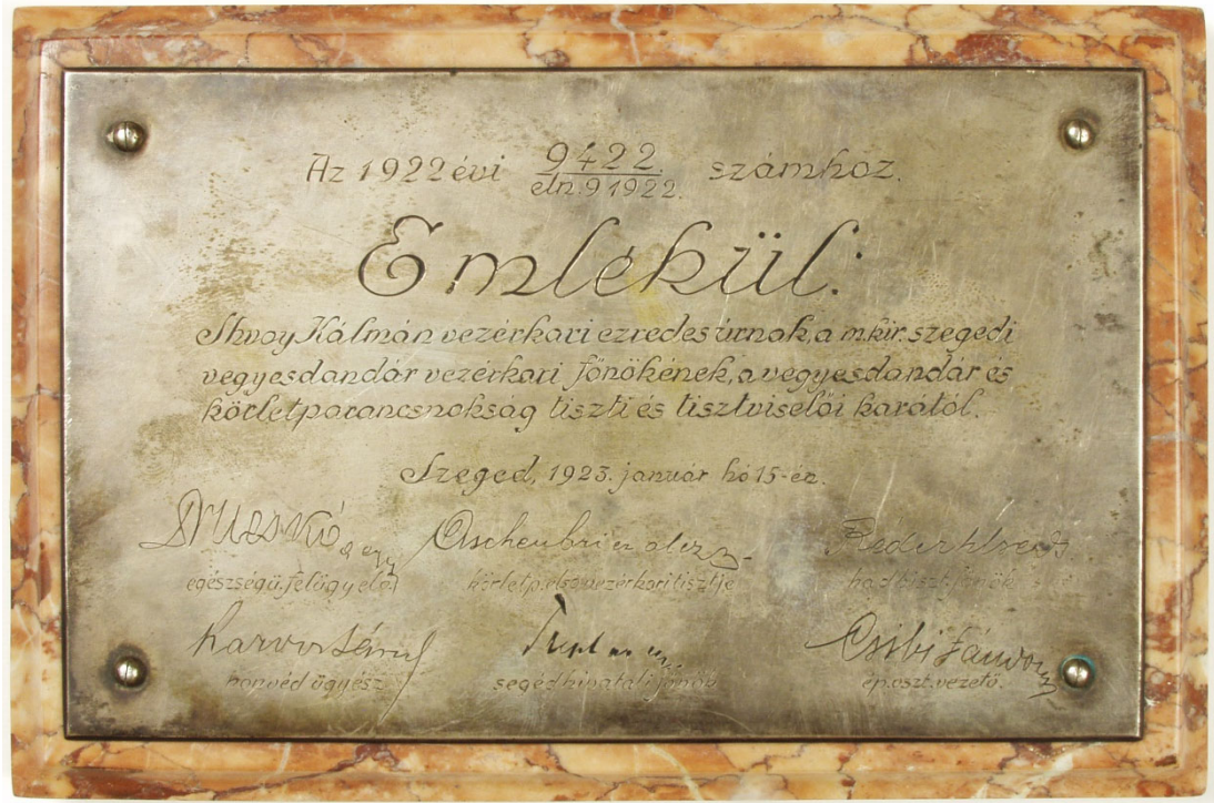
2. ábra: A Móra Ferenc Múzeum MFM Tt. 2002.470.1. jelzetű emléktáblája, amely egy kisméretű fémlap vörösmárványra fogatva. A tárgy méreténél fogva és a rögzítő kampó hiányában csak asztali dísz lehetett.